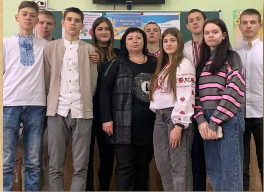
Позааудиторні заходи до Дня рідної мови