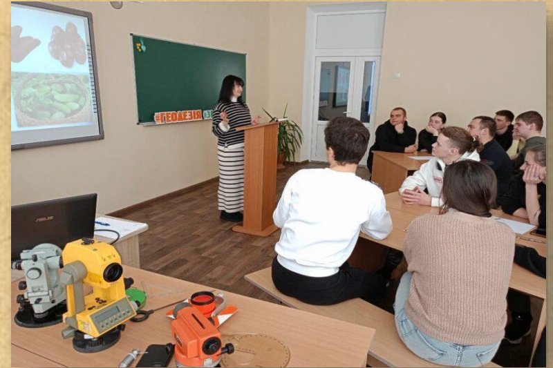
Інтелектуальна гра «Землевпорядний батл»