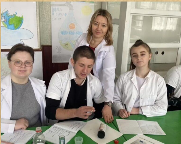
Засідання хімічного гуртка на тему: «Вода для життя. Дослідження якості питної води»