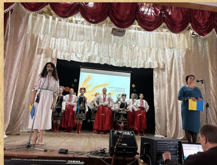
Святкова програма до Дня працівників сільського господарства