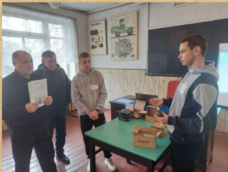
Навчально-пізнавальна гра «Хвала рукам, що пахнуть хлібом»