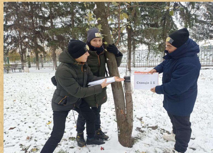
Навчальний квест «подорож країною «Агрономія»