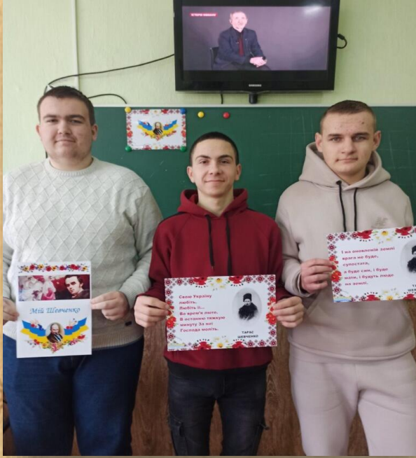
Виховні заходи до 210-тої річниці Т. Г. Шевченка