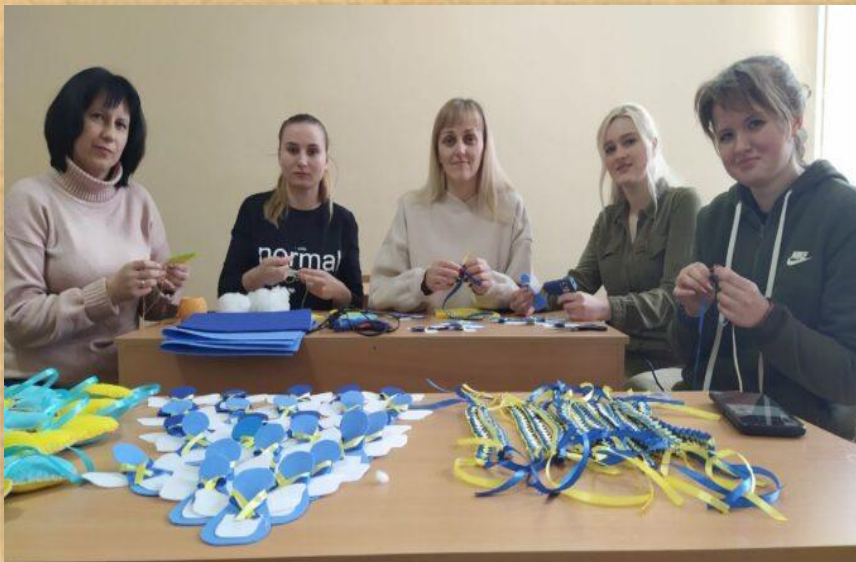
Виготовлення оберегів для захисників