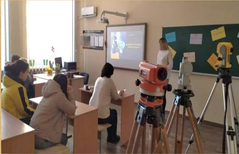
Виховний захід «Дайджест професії «Землевпорядник»