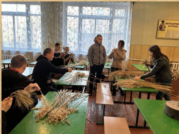
Майстер – клас «Виготовлення дідухів»