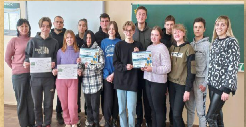
Гео перегони «Вимірюю знання, покращую навички»